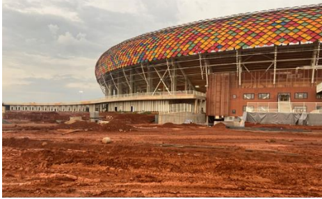
VVIP and VIP entrance: