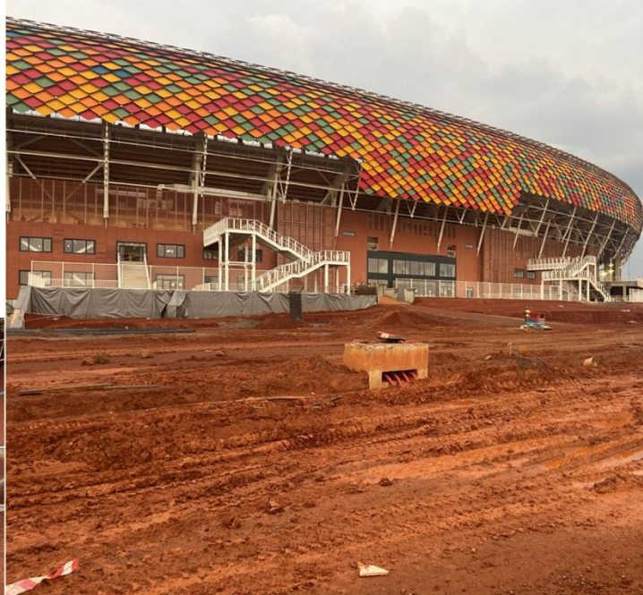
VVIP parking & PMAs parking: